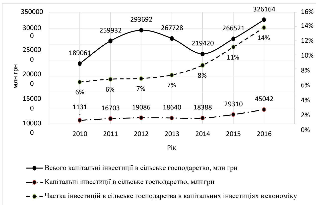
Рис. 2.1. Капітальні інвестиції в економіку України та сільське господарство, млн грн [31-36]

Ті підприємства які швидше проходять цей процес мають більше можливостей вижити в жорсткому ринковому середовищі, підтримуючи високий рівень конкурентоспроможності як продукції, що виробляється, так і підприємства в цілому. Одним із індикаторів цього процесу є обсяг інвестицій в сільське господарство. Як видно з рис. 2.1 обсяг інвестицій у сільське господарство в 2016 р. збільшився в 4 рази порівняно з 2010 р. Потрібно відмітити, що в 2016 р. розмір інвестованих коштів досяг свого максимуму і становив 14 % від усіх капітальних інвестицій в економіку країни (в 2010 р. цей показник становив 6,4 %).