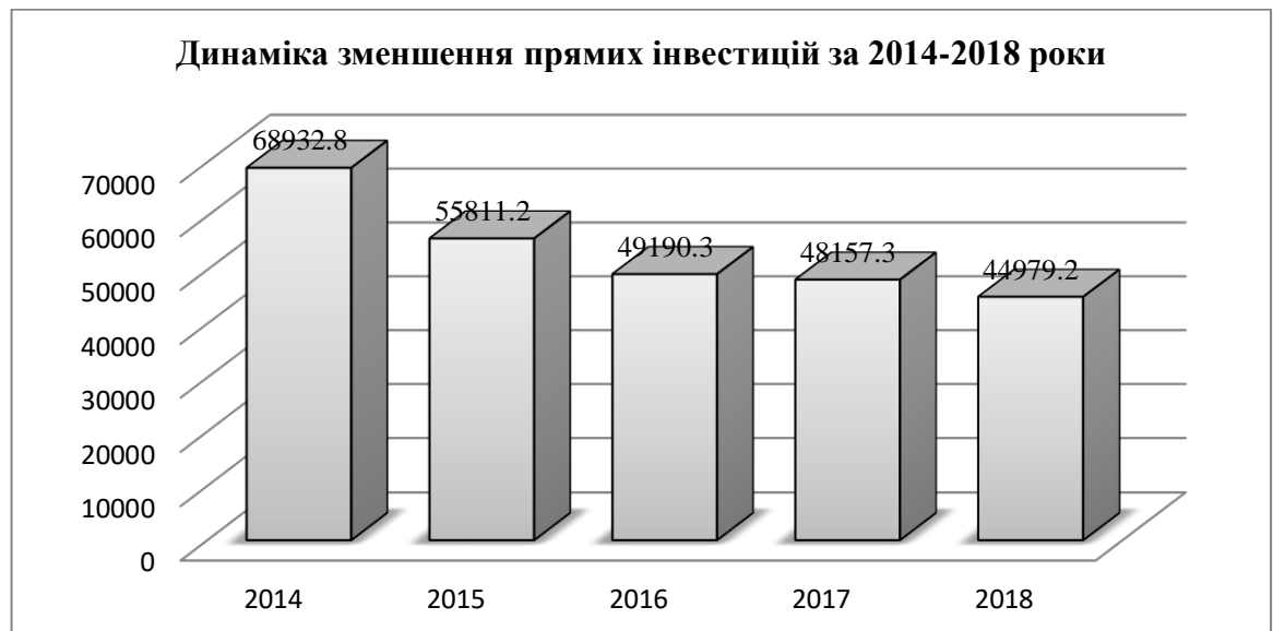
Рис.1 Діаграма зменшення прямих інвестицій в економіку регіону

На рис.1 наведемо діаграму зменшення прямих інвестицій: